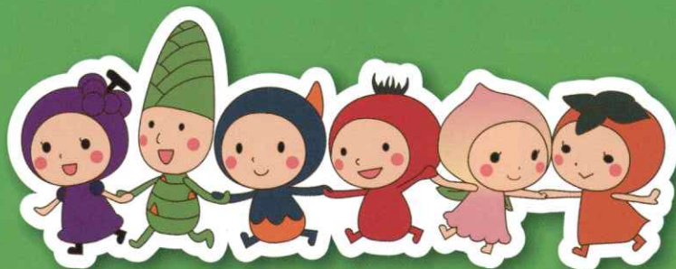
グレーブル アスピー クワッピー トマビー モモエル カッキー