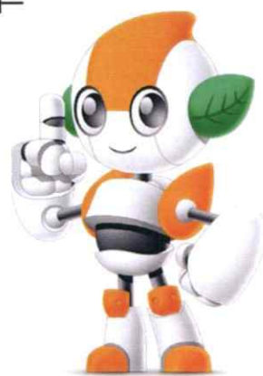
伊予鉄総合企画 働き方改革推進キャラクター IyoRobo

“RPAで取り組む働き方改革”とスローガンを掲げ、既存の人材サービスとあわせ、地域の働き方改革に貢献し、人材×RPAで企業の新しい働き方改革を応援します。