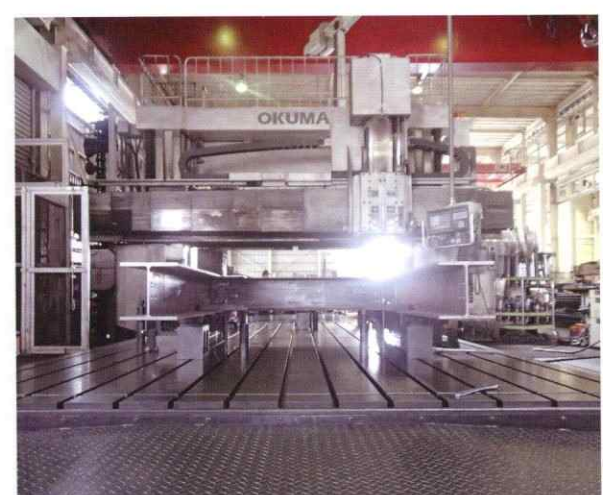
▲大型五面加工機(オークマMCR-A5C) 加工範囲(X: 6000・Y: 3000・Z: 1500)