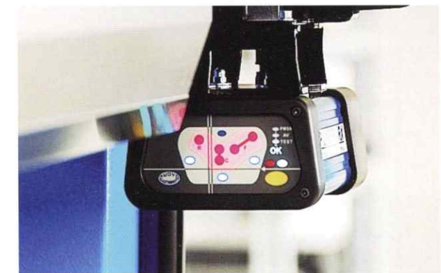
◀プレスブレーキ用レーザー式安全装置 DSP-J

労働安全衛生規則第131条改正により、既存のプレスブレーキに安全装置を取り付ける事が義務付けられました。御社に既に設置してある既存のプレス機器にも、「プレスブレーキ用レーザー式安全装置 DSP-J」を当社が責任を持って取り付けを行います。