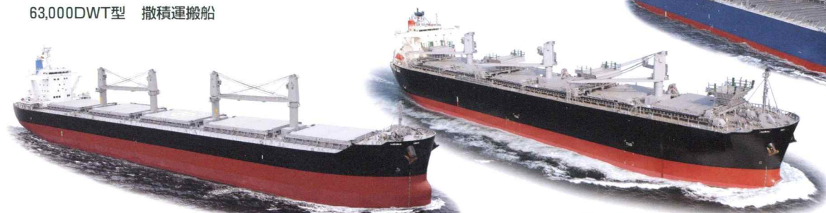
63,000DWT Bulk Carrier (L)199.98×(B)32.24×(D)19.15