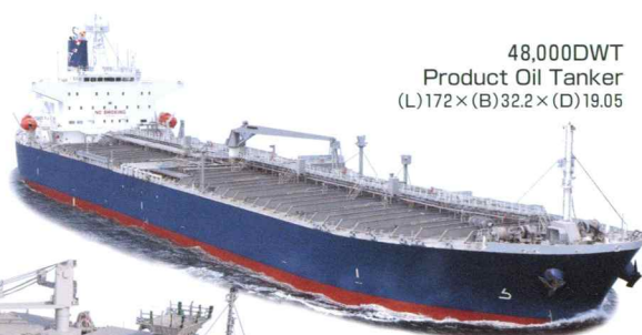
48,000DWT Product Oil Tanker (L)172×(B)32.2×(D)19.05