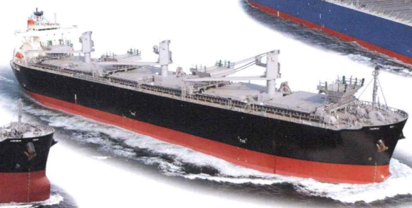
3,600,000CF Wood Chip Carrier (L)199.91×(B)32.2×(D)22.65