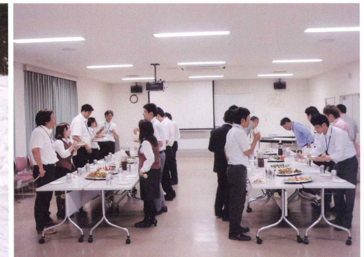
研究発表会後の懇親会