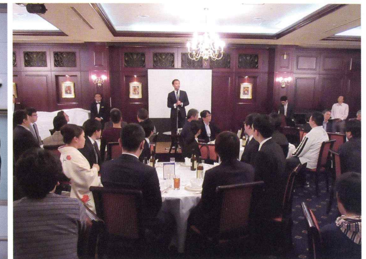
ファミリーフェスタ:家族と一緒にパーティ