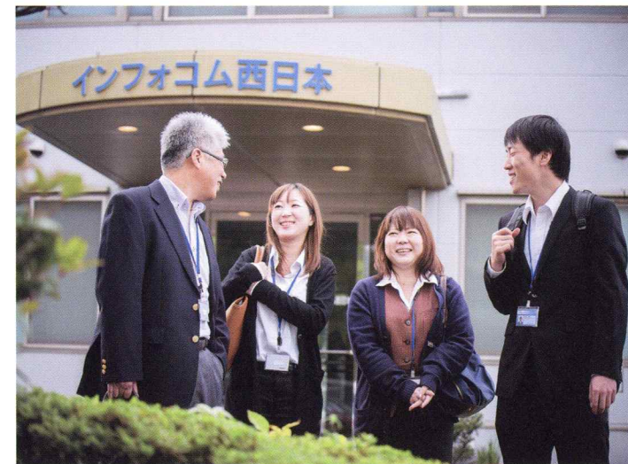
風通しのよい社風

導入された業務システム、ソフトウェアパッケージについて、機能維持・拡張、障害復旧、操作指導等を通じ安定稼働の維持に貢献します。また、ユーザからの問合せ等に対応するヘルプデスク窓口も行い、システムを円滑にご利用いただくためのサービスを提供します。