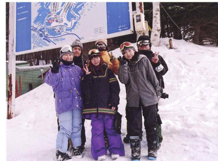
同好会:好きな者同士で交流