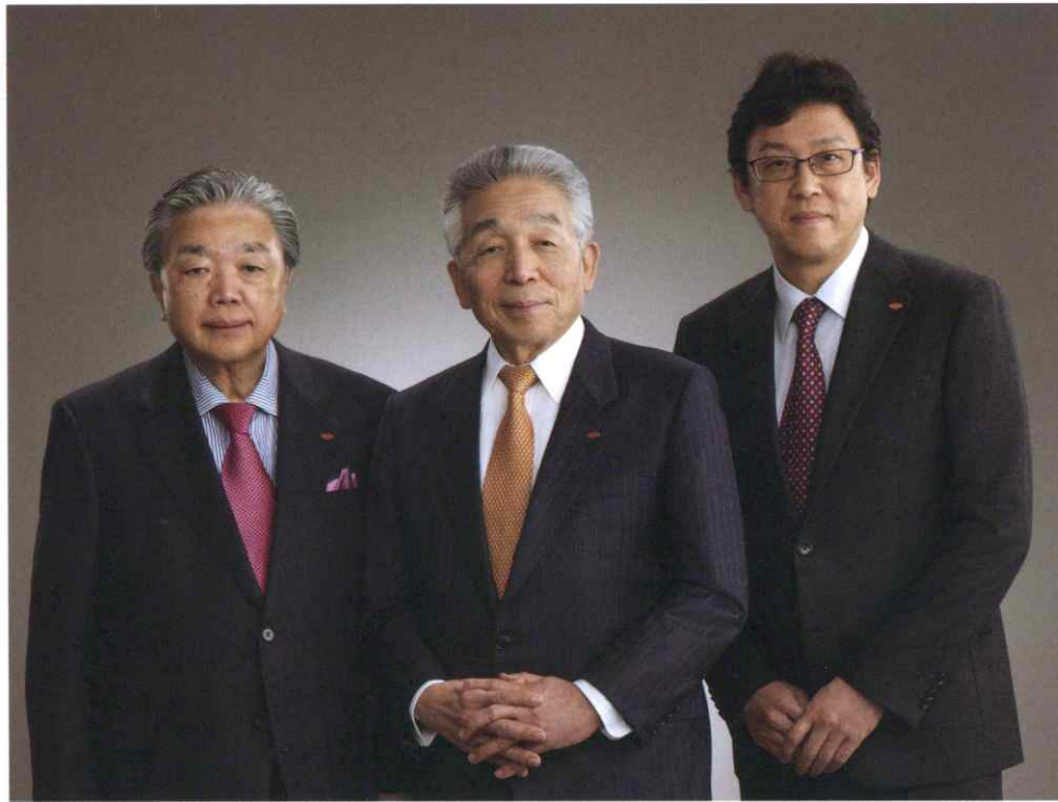
イカリ消毒株式会社 代表取締役社長

We, Ikari Environmental Group, have been working to achieve this kind of environmental culture with the "Creation of Beautiful Cities" as our business concept.