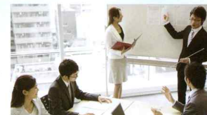
コンサルティング

基礎から専門知識まで、最新の技術と情報を反映したワークショップや模擬監査、実物観察などを通じ、実践的なスキルが身につく従業員教育を提供します。