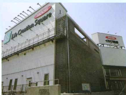
Life Creation Square

安全で使いやすく、かつ効果のある防除機器を生み出すために、専用ラボでの試験や現場での実証実験を繰り返し、より良い商品を創出しています。