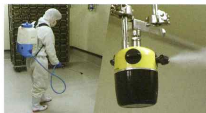
サニテーション・デコンタミネーション