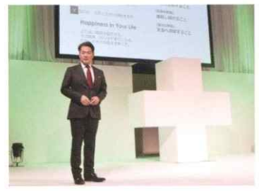
HTP Meeting 2020(全社員大会)