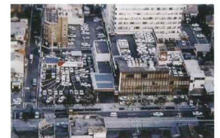
1970年代 広島トヨペット本社