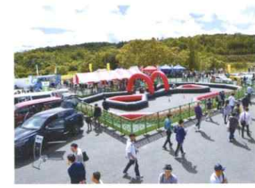
広島トヨペットドライブ王国