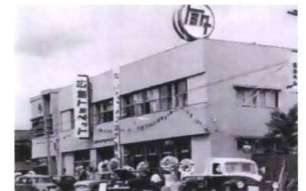
1956年 広島トヨペットに社名変更