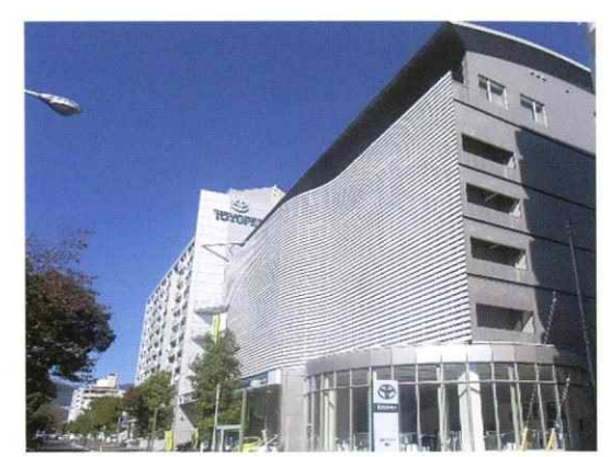
広島トヨペット 本社