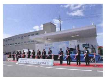
東広島水素ステーション