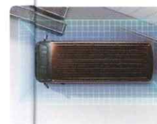
インテリジェント アラウンドビューモニター