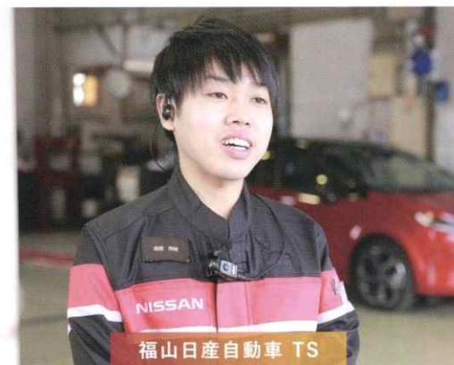
2019年入社/日産京都自動車大学校出身