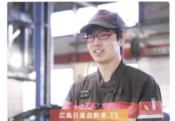
2012年入社/広島国際学院大学自動車短期大学部出身 (現 広島国際学院自動車整備大学校)