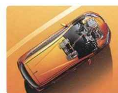
電気自動車技術 (EV・e-POWER・e-Pedal)

日産は「CO2排出ゼロ」「交通死亡率ゼロ」といった、安全かつ持続可能な社会の実現に向け、「ニッサンインテリジェントモビリティ」というビジョンを掲げ、クルマを未来へと導きます。