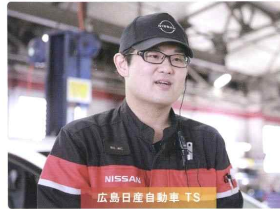
2015年入社/広島自動車大学校出身

この仕事は、お客さまの車を点検して、安心安全を提供するお仕事だと思っています。整備結果説明の時に、快適に乗っていただけるように、工夫してお話しをしています。職場ではとても人間関係が良く、休憩中楽しくしゃべったり、プライベートで先輩や同期と一緒にゴルフに行ったりして楽しい環境です。