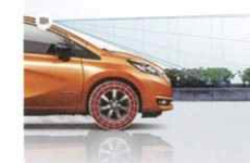
自動ブレーキ (インテリジェントエマージェンシーブレーキ)