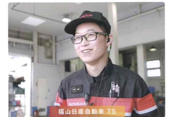
2014年入社/広島県立福山高等技術専門校出身