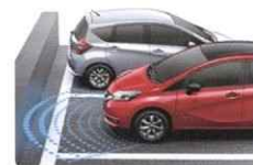
踏み間違い 衝突防止アシスト