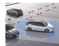
自動駐車システム (プロパイロットパーキング)