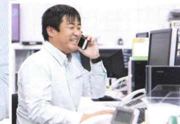
協力業者と工程や品質・安全を管理しながら、施工を円滑に進めていきます。

私 の仕事は簡単に言うと現場監督で、お客様に安心していただき、ご要望通りに現場を進めていきます。お客様にとっては営業、設計、コーディネーターから仕上げ、そして最後の窓口となります。仕事で一番やりがいを感じることは、やはりお客様の評価ですね。お客様の声で私たちは育ててもらっているのだと感じています。また、完成した家を引き渡す数が、私が担当したものだけで年間で60棟にもなろうとしています。一監督が年間に引き渡す数としては、他のハウスメーカーさんではありえないことです。高品質でお客様に満足していただき、それをやれる仕組みづくりができていっているのはヘルシーホーム以外ないと思います。