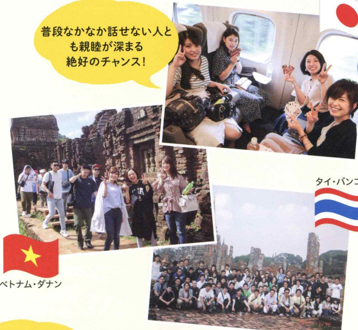
ベトナム・ダナン