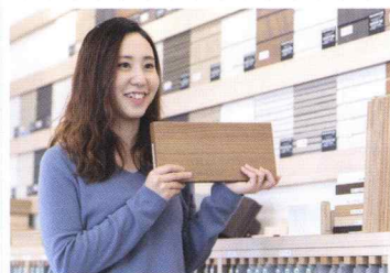
見える部分だからこそ、具体的なご要望やごだわりをたくさんお聞きすることができます。

契 約後、家の外壁や内観の色を決めていきます。お客様にとって一番楽しいと感じられる工程で、いろいろなご意見やご主人・奥様それぞれがごだわられる場所など、話を進めていくのは難しいことでもあります。とてもやりがいを感じます。たくさん打ち合わせをさせていただいたお客様から、家が完成して「やっぱりあの色が良かったよ!」とか、「言ってくれたのが良かったよ!」という一言がすごく嬉しいです。私たちが一番ご要望をお聞きする担当ですので、これからはどんどん意見を出して、新しい商品づくりにつなげていけたらと思っています。ヘルシーホームは、やった分だけ評価をしてくれますし、社員の声も尊重して反映させてくれる会社だと思います!