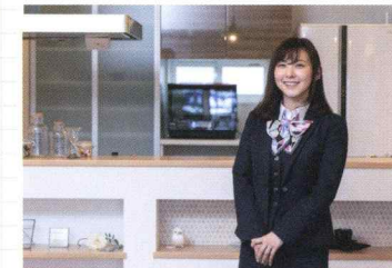
ご来店されるお客様の対応のほか、展示場やモデルハウスのご案内も行います。

「フロント受付にて、お客様の対応や、営業担当の方の契約後のフォロー業務をさせていただいています。ヘルシーホームには「お客様満足課」という課があり、契約をさせていただいたお客様一人おひとりへの資料作りや、銀行への手続きなどのフォローをしています。お客様にご契約をいただいた際、一緒に写真を撮らせて頂く場面があるのですが、その時の笑顔がすごく素敵で、そのお顔が見られることがいつも励みになっています。様々な仕事をこなし、「一人三役」とも言われるので慣れるまで大変な部分もあると思いますが、自分のスキルアップにつながるので、チャレンジ精神のある方には最適な会社だと思います。」