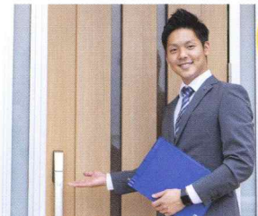
家を引き渡した時に「ありがとう！」と Saying いただいたときが一番嬉しいです。