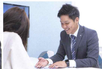
お客様との打ち合わせは、ご要望を少しずつ形にする大切な機会です。

「来場いただいたお客様に新築住宅のご提案をしています。家や土地のことなどお客様が知りたいことに対して答えていくほか、ご来場されたお客様のイメージは明確では無いことが多いため、いろいろご提案させていただいて一緒に要望を明確にしていきます。契約した時はもちろんですが、お客様と一緒に考えた理想の家を、引き渡した時にはとてもやりがいを感じます。ヘルシーホームには、入社してすぐに住宅を売れるだけの仕組みが整っているので、お客様へのコミュニケーションや提案に注力できます。営業マンを徹底的にサポートする制度もあるため、経験ゼロでも安心して入社していただけます！」