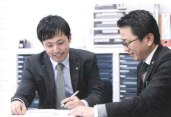
営業と一緒に打ち合わせをしながら、お客様の思いを形にしています。

「お客様からご要望を伺って、図面として形にしていく仕事をしています。ご契約の前やすぐ後は、まだイメージが固まっていなかったり、逆に図面を持って来られるお客様もおられるので、それに合わせて対応していくところが一番難しくもあり楽しいところです。責任のある仕事を任せられることが多いですが、その分やりがいにつながり日々成長を感じながら仕事をしています。ヘルシーホームでは、設計も営業も工務もそれぞれの部署が1人のお客様、1つの家族に対して密に接しているのを感じます。単純に「担当」でなく、お客様にきちんと接することができる体制ができているからだだと思います。頑張った分お客様も喜んでいただけますし、自分の力になることが実感できますね。」