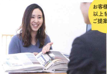
お客様に寄り添い、何を求めているかを常に考えながらご提案しています。