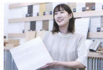
お客様の思いを汲み取り、イメージを共有できるように工夫しています。

「面が確定して、具合的な仕様を決める段階でお手伝いをさせていただきます。決めきれないお客様にアドバイスをして納得いただくというのが理想ですが、私の場合はとことん一緒に悩んでしまうことも多々あります。それでも、決定の印鑑を頂く際に「一緒にがんばって決めたから悔いはないです！」という言葉をいただいたり、完成の時に喜んでいただけることで、私も日々達成感を感じながら仕事ができます。営業、設計、コーディネーター、そして工務といった4つの役割が関わりながら、様々なご家族のお家づくりが日々行われています。色々な人と関わりつつ多くの視点を持ちながら働きたい、という人にはぴったりの会社なんじゃないかなと思います。」