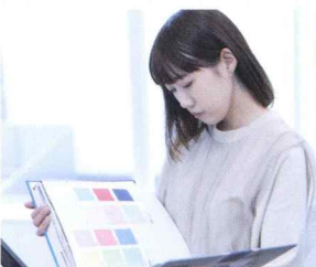
要望を反映するだけでなく、最新のトレンドを取り入れた提案を心がけています。