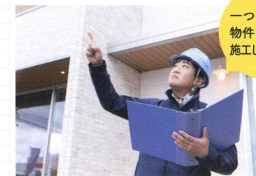
お引き渡しの時まで、細部まで目を光らせて徹底的にチェックします。