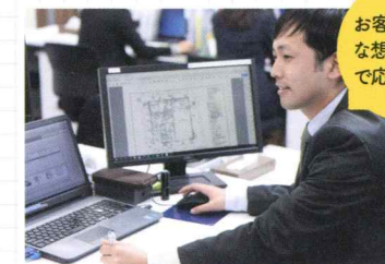
お客様が実際に暮らすシーンをイメージしながら図面を作図しています。