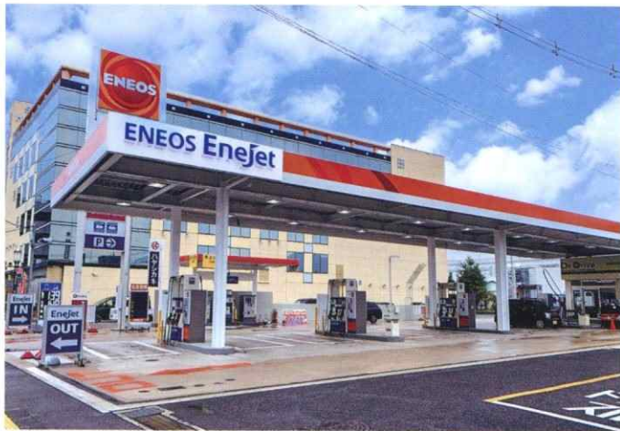
Dr.Drive イオンモール前SS (広島県広島市)