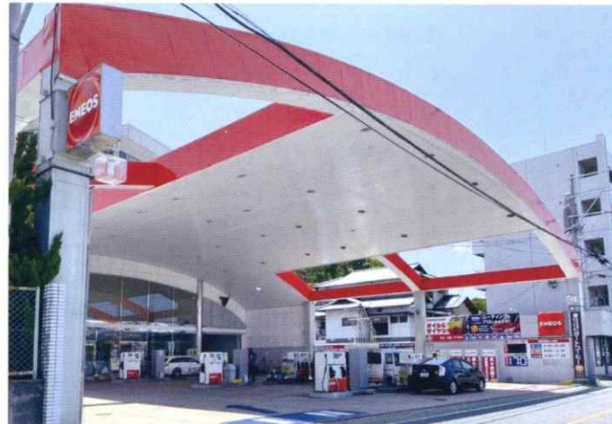
リバーサイド友泉亭SS (福岡県福岡市)