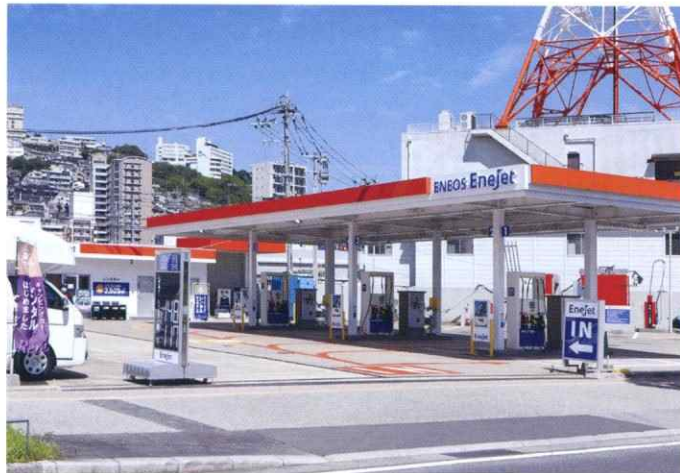
ハーバー長崎SS (長崎県長崎市)