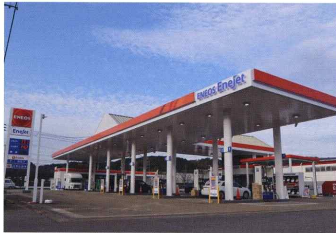
セルフ・トリアス前SS (福岡県糟屋郡)