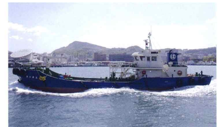
船舶に給油のため活躍する給油船