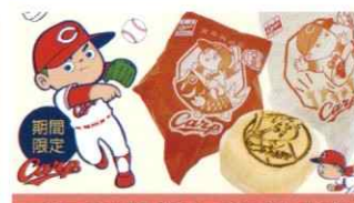
【カープ×八天堂】カープなくくりーむパン