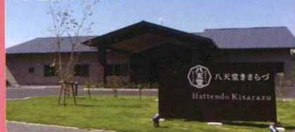
販売・工場見学・パン作り体験ができます!