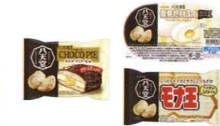
【LOTTE×八天堂】チョコパイ・雪見だいふく・モナ王