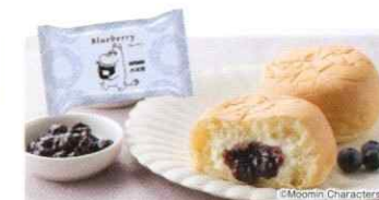
【MOOMIN×八天堂】くりーむパンブルーベリー