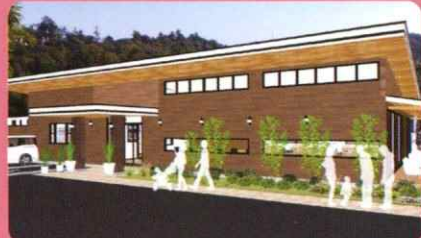
カフェとマルシェを併設した施設をオープン予定