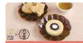
【ローソン×八天堂】ロールケーキ・たい焼き