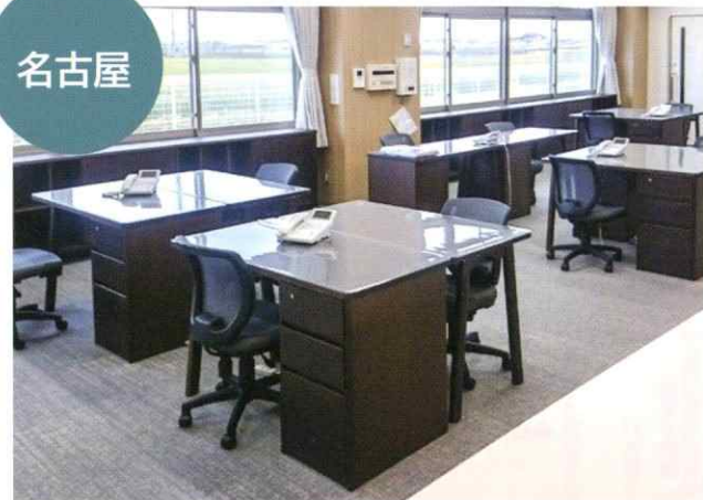
デスク、リビングボード、リビングチェア、ダイニングセットを納入

名古屋と札幌の高齢者介護施設の2施設に浜本工芸の家具を納入させて頂きました。 ご高齢の方々が過ごす空間を彩るお手伝いができ、光栄です。