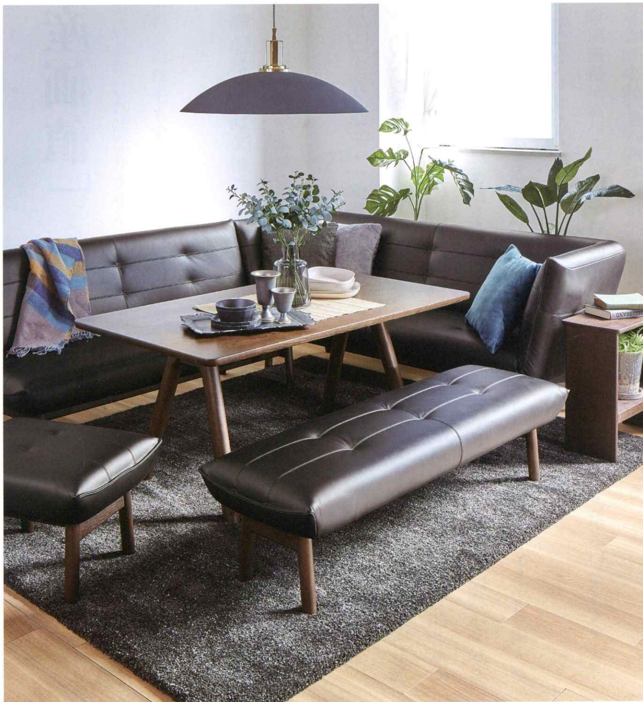
No.3000リビングダイニングシリーズ

hamamoto group communication magazine mebae