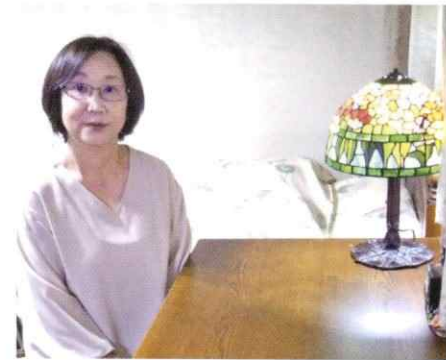
▲ご実家では娘さんの机をお母様が引き継ぎ、30年間大切に愛用いただいています。