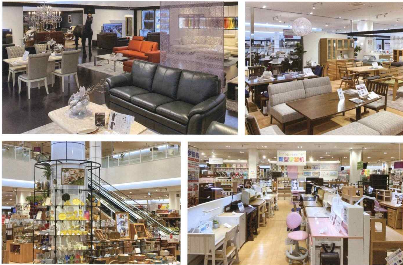
▲整理された売り場には個性豊かな雑貨などをはじめ、座り心地や機能性に優れた家具が並ぶ。