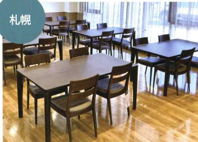
リビングチェア、センターテーブル、ダイニングセットを納入