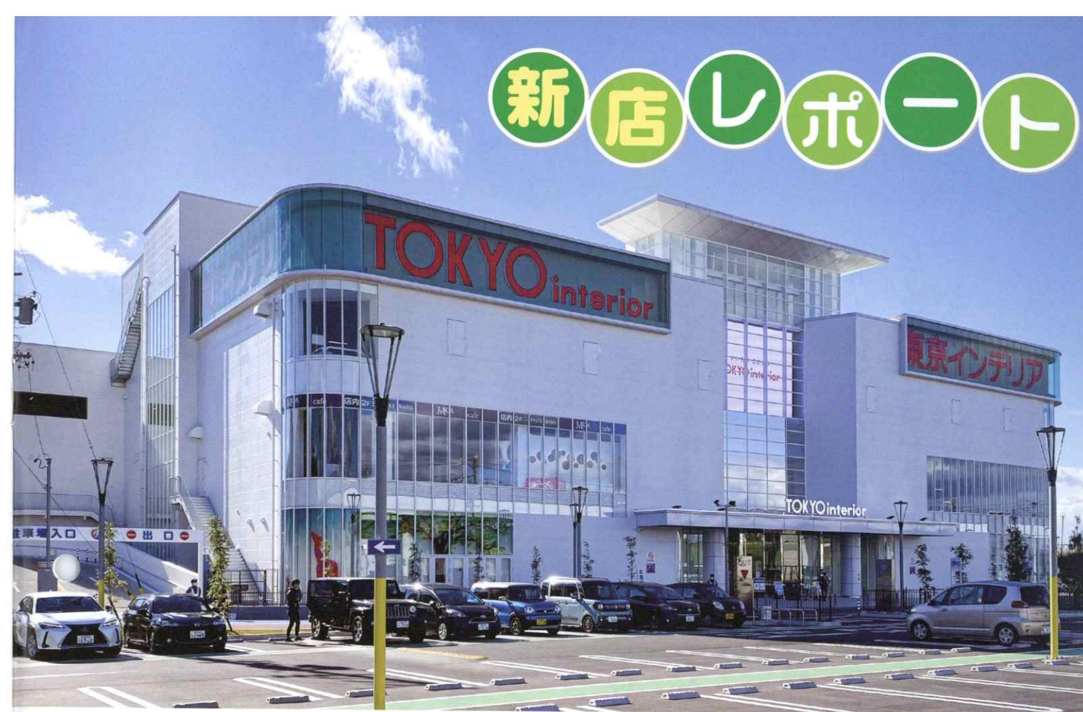
▲2フロア計2,900坪の長久手店。近隣には高速道路のインターチェンジやリニアモーターカーの駅があり、交通アクセスも抜群。

浜本工芸について 厳選したナラ無垢の良い材料を使用していることがはっきりと伝わり、安心してお客様にお勧めできます。往年の重厚感あるシリーズから、最近のスタイリッシュなデザインもあり、幅広い世代に人気です。木部色が三色ありコーディネートしやすくご好評を頂いております。