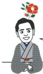
「めばえ」編集室 川路

「めばえ」のご感想・ご投稿などございましたら、 下記アドレスまでお願いいたします。 mebae@hamamotokougei.co.jp