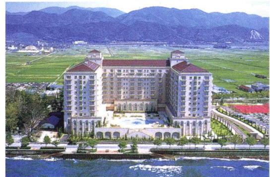
・エクシブ 琵琶湖

わが社では会員制レジャークラブにも加入しており、全国各地にある保養所や宿泊施設を利用することができます。