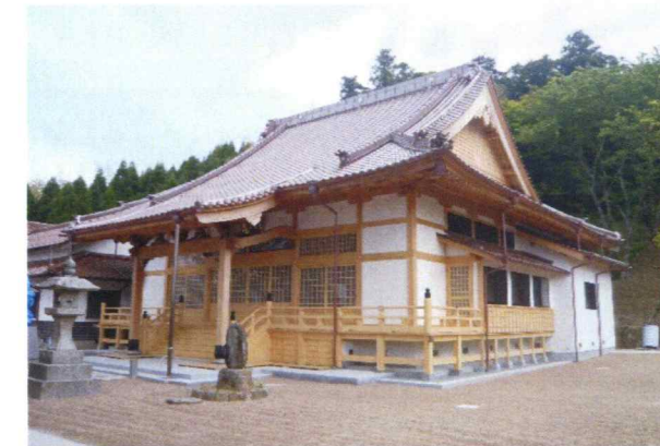
妙蓮寺新築設計・監理