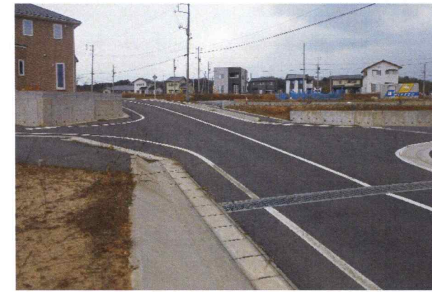
板津線&板津土地区画整理事業 測量・設計・補償