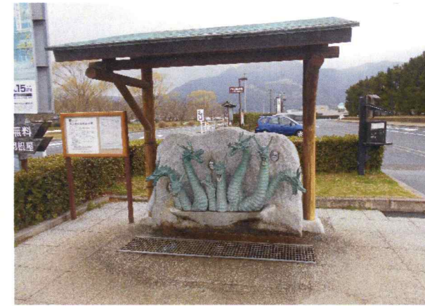
浜山湧水飲水汲み場水源設計