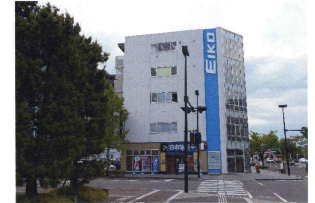
エイコー駅南ビル新築設計・監理