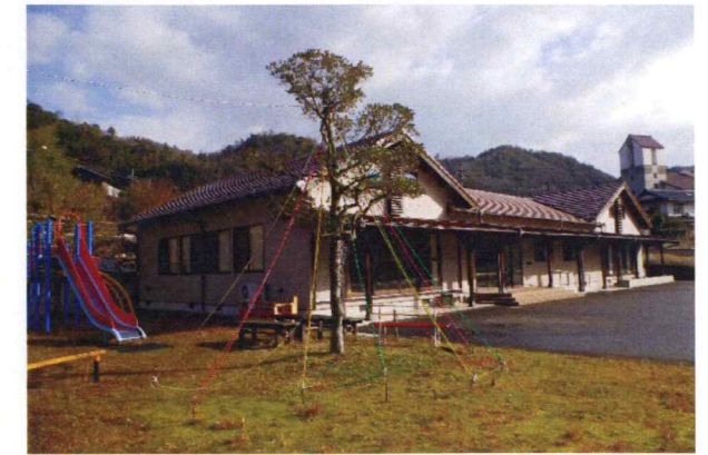
稗原交流センター新築設計・監理