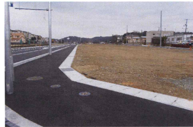
松江市宇竜谷地区土地整理事業 実施設計