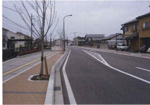
二京町三京町線道路 測量・設計・補償