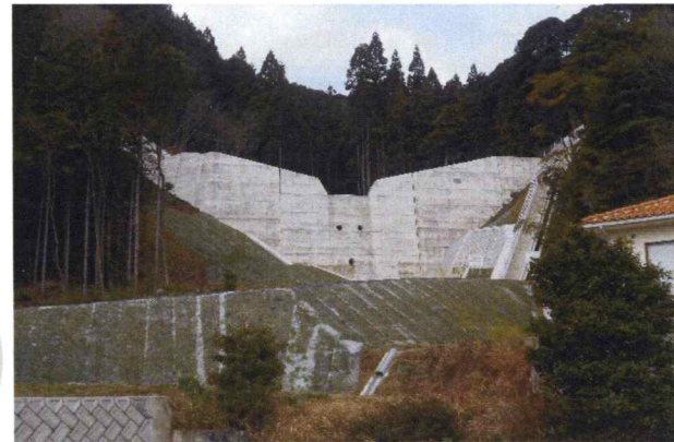
大人谷川砂防堰堤 測量・設計・補償