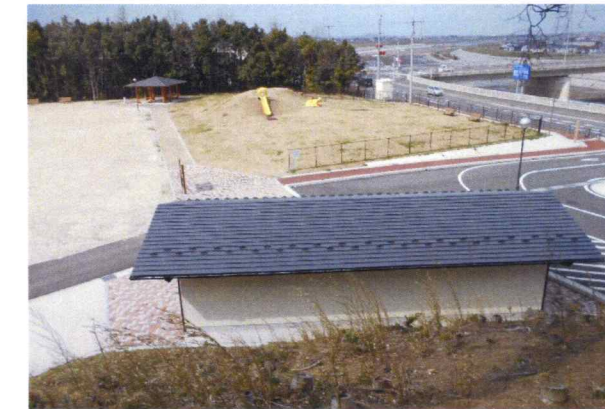
半分公園設計・建築設計・測量