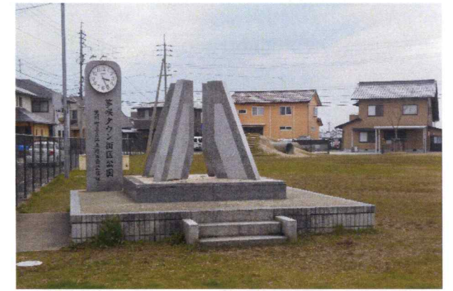
夢咲タウン公園設計