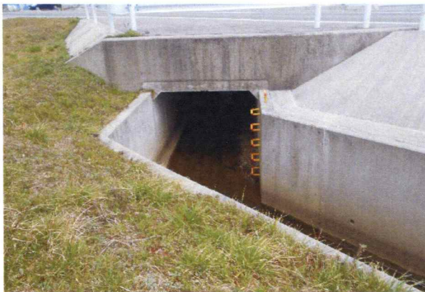
藪崎小池谷線 測量・設計・補償(BOXカルバート)