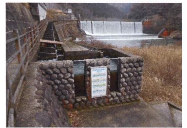
日登堰堤魚道設計