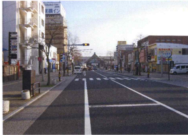
出雲市駅前矢尾線道路 測量・設計・補償