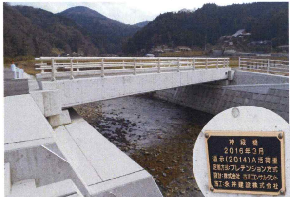
神段橋 測量・設計・調査