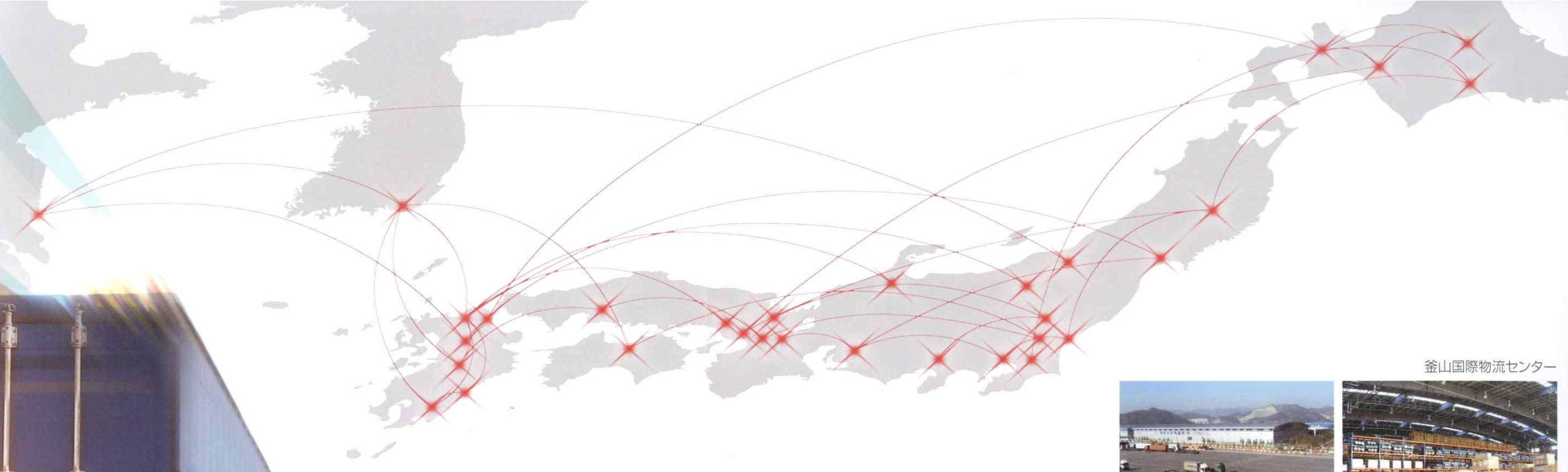
釜山国際物流センター