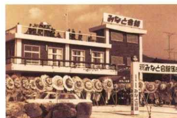
結婚式場みなと会館オープン 昭和42年10月22日