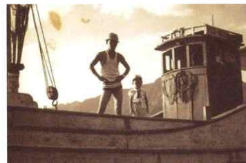
藤清丸にて、会長・社長