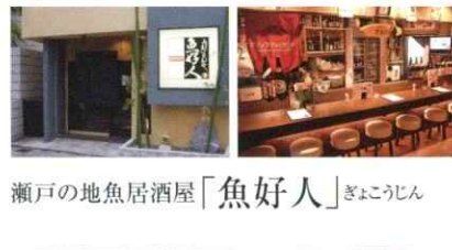
瀬戸の地魚居酒屋「魚好人」ぎょうじん