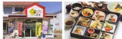
味と心の宅配便「仕出しのふじま」