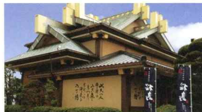
活イカ・海鮮料理「八丁槽」はっちょうろ