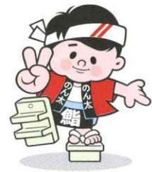
のん太鮎 キャラクター のん太くん