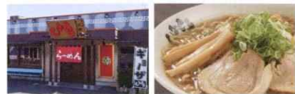
毎日食べても飽きない和風ラーメン「しなとら」