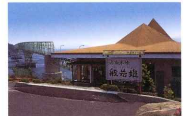
般若姫大島店オープン 昭和53年3月12日