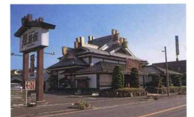
般若姫徳山店オープン 昭和61年4月14日