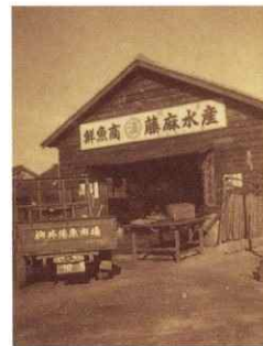
創業当時の魚市場