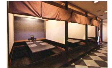
アニバーサリーステージ ベルゼ「一心」