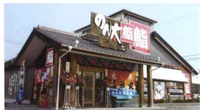
魚市場直営のグルメ回転寿司「のん太鮓」