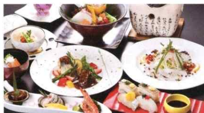
地魚ざんまい「一心」