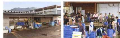
柳井港魚市場「藤麻水産」

ご家族での食事から、大人数のイベントまで、食を通じてお客様の喜びのお手伝いをさせていただき 感動カンパニーとして、更なる発展を目指して、今も進化し続けています。