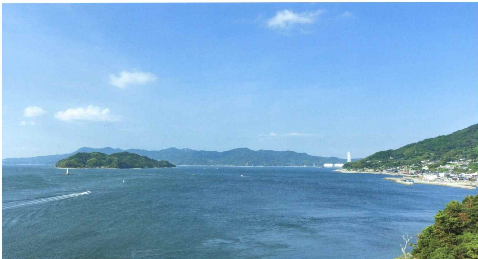
大島大橋から柳井港を望む