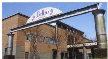
ブライダル・パーティ・大型多目的ホール「ベルゼ」

私たちフジマグループは、飲食業として創業60年以上の歴史を持つ会社です。 県内最多数の和食のプロ調理師が在籍し、従業員数500名を超える感動創造企業です。 柳井市を拠点に、魚市場を始めとし、仕出し2店舗、結婚式場、和食レストラン8店舗、 回転寿司4店舗、海鮮居酒屋3店舗、ラーメン店2店舗など山口・広島で20数店舗展開しています。