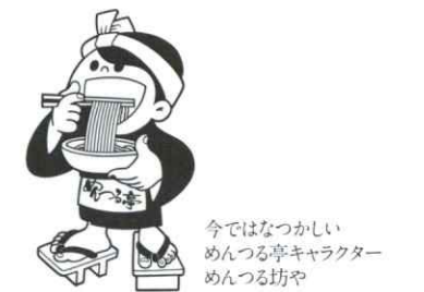
今ではなつかしい めんつる亭キャラクター めんつる坊や