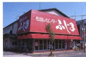
「むすびのふじま」として徳山に進出 昭和50年8月8日

徳山本店 徳山常盤店 下松大手町店 それぞれを同時オープン フジマグループ社員総数100名に達す (昭和50年9月30日) 株式会社みなと会館 資本金500万円とする 株式会社 藤麻水産 資本金500万円とする