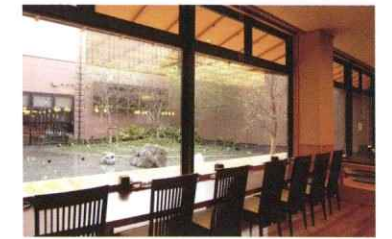
ほの湯楽々園内「もみじ」