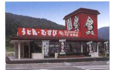
めんつる亭防府末田店オープン 昭和56年7月7日