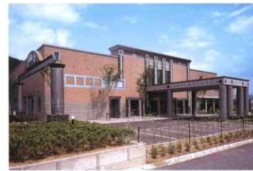
アニバーサリーステージ ベルゼ オープン 平成4年8月28日