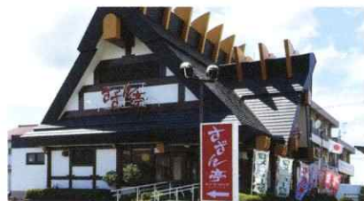
家族団らん和風レストラン「さざん亭」