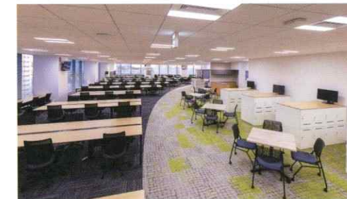
オフィス(エキキタ)

働きやすいワークスタイルで、働く人が幸せな会社を目指して、オフィスのフリーアドレスやテレワークなどを導入しています。