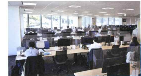
オフィスでの業務の様子