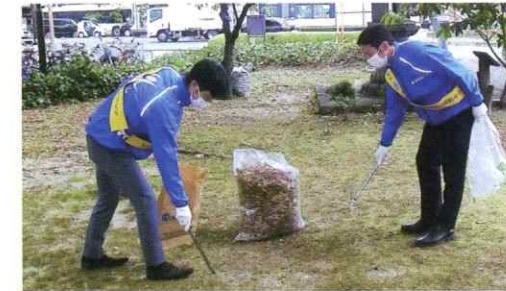
事業所のある地域で行われている清掃活動に参加しています。

中国地方を拠点に、地域のみなさまと共に歩む企業として、地域に根ざした社員参加型の社会貢献活動を積極的に進めています。