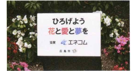
花と緑のまちをつくる、広島市のグリーンパートナー事業に協賛しています。