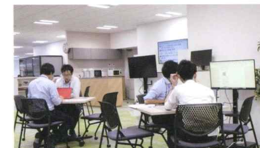
ミーティングの様子