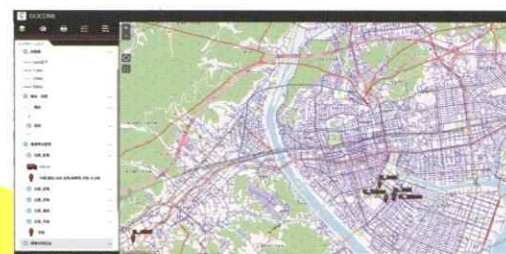
開発システム例(配電システム)