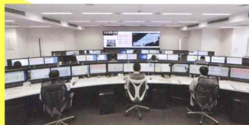
24時間365日のネットワーク監視体制