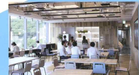
社内での共創(LABOスペース)