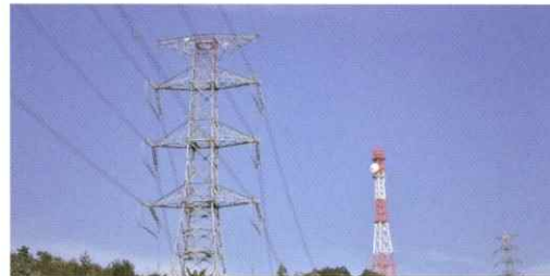
送電設備の一部を活用した災害に強い光中継網

お客さまの大切な情報を守る、EneWings広島データセンターなど、強固なセキュリティと充実した設備、確かな技術でサービスを支えています。