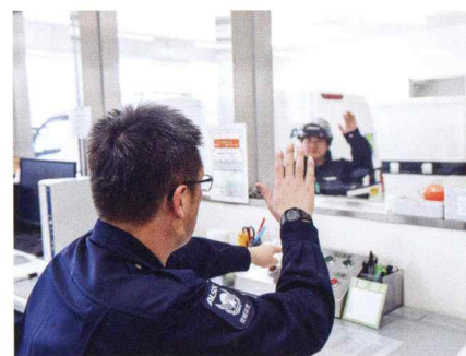
統制員や資金精査員

安全で正確な保管・運搬には、統制員や資金精査員の支援が欠かせません。統制員は隊員が運転する警備輸送車両の位置をGPSを用いて愛媛県下全車両分管理しており、専用設備で安全な運行を統制管理し、適宜適切にオペレーションします。持ち帰った現金などは、資金精査チームによって正確に精査、保管、管理され、出荷時にはその準備も行います。お客様との信頼関係を守り続けていく上で、非常に頼りになる存在です。