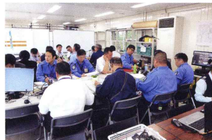
県内外の警備会社が集結する 警備統括本部

大型イベントでは、1日数百人の警備員が必要になることもあります。このような規模の警備を成功させるには、県内外の警備会社の協力が欠かせません。えひめ国体では、54社、6,000人の警備員を束ね、何度も協議を重ねて警備計画を立て、訓練を繰り返すことで無事に警備に関する事故ゼロを達成することができました。イベント成功という1つのゴールに向かって、時には会社の垣根を越えて警備に当たります。