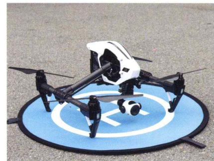
最先端セキュリティ機器

AI、高性能カメラ、ドローンなどの最新の機器や技術をいち早く業務に取り入れることで、他社との差別化が図れるほか、お客様に対して常にクオリティの高い警備を提供することができます。セキュリティシステムの施工を行う工事協力会社や各メーカーのシステムエンジニアなど、最先端技術に素早く対応できる優秀なバックアップメンバーが、ベストなシステムを提案する上で必要不可欠です。