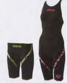
アクアフェース ライトニング Aquaforce Lightning

宮城県西都市 TEL. (0983) 44-5241 Saito, Miyazaki TEL. +81-983-44-5241