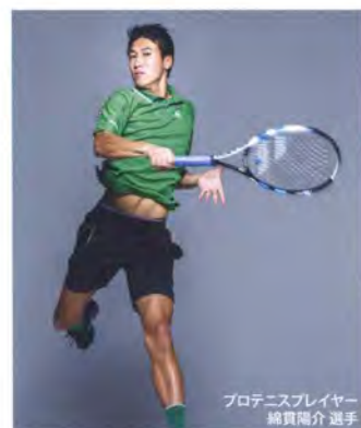
プロテニスプレイヤー 錦織陽介選手