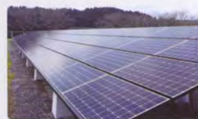
西都工場に太陽光発電システムを導入(デサントアパレル株式会社) A solar power generation system has been installed at the Saito Factory (DESCENTE APPAREL LTD.)