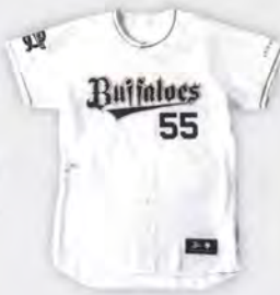
オリックス・バファローズ ユニフォーム Orix Buffaloes uniform

兵庫県美方郡香美町 TEL. (0796) 98-1211 Kami-cho, Mikata-gun, Hyogo TEL. +81-796-98-1211