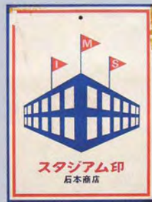
1953年(昭和28年)の野球ユニフォームの商標 A registered trademark for baseball uniforms in 1953

1953 : Cream-Colored Baseball Uniforms DESCENTE successfully developed cream-colored baseball uniforms and training pants made from pre-shrunk cotton fabric with a wool-like finish. Capitalizing on a baseball boom, these items became hit products.