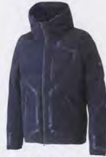
水沢ダウンジャケット 「ストーム」 Mizusawa Down Jacket "storm"

岩手県奥州市 TEL. (0197) 46-2313 Oshu, Iwate TEL. +81-197-46-2313