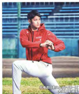
北海道日本ハムファイターズ 大谷翔平選手