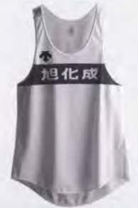
旭化成陸上競技部 ユニフォーム Asahi Kasei Track & Field Club uniform

奈良県吉野郡 TEL. (0747) 52-3940 Yoshino-gun, Nara TEL. +81-747-52-3940