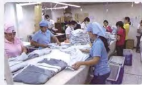
製品の仕上げから梱包作業までを第三者機関が監査(ベトナムの縫製工場) An independent organization supervises all processes from product finishing to packaging (Sewing factory in Vietnam)