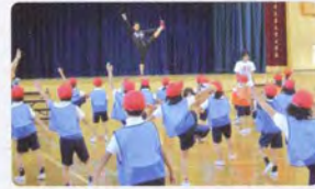
すこやかキッズスポーツ塾 東北支援 Providing support to the Tohoku region through the Sports School for Healthy Kids