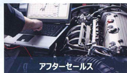
アフターセールス

産業機械の専門技術、PL法、労働安全の法規に精通したスタッフが、各種資料を企画・制作します。トラブルシューティング類の改善提案や、海外の製品安全規格への対応も承ります。