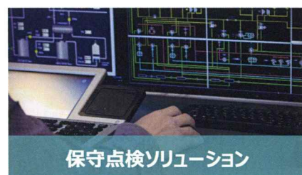
保守点検ソリューション

製品のメンテナンスや修理に必要な交換部品を正確・迅速に注文するためのパーツカタログや、部品発注システムを開発しています。すみやかに最適なアフターサービスをサポートします。