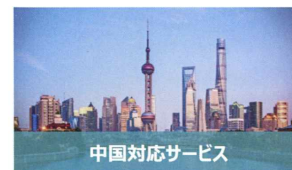
中国対応サービス

製品マニュアルやPR資料制作などをローカライズすることで、海外企業の日本進出や、国内企業の海外事業展開をサポートします。法規や文化など現地の状況に合わせて翻訳します。