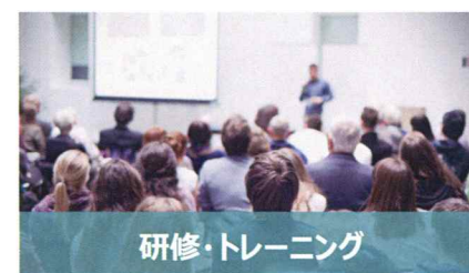
研修・トレーニング

製品事故やPLリスクを防ぐお手伝いをします。また、輸出トラブル回避のため、海外の法規・規格への対応を支援します。これらの「アフターセールス設計」を、全面的にサポートします。