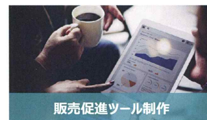
販売促進ツール制作

製品を長期間にわたり効率的に活用するための、保守点検システムをご提案します。 ・遠隔監視・点検システム ・ビッグデータ分析による予測システム ・遠隔修理ナビゲーションシステム など