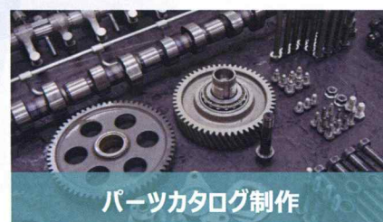
パーツカタログ制作

営業や販売現場のプロセスを整理し、最適化するための提言をします。現場のパフォーマンスの一貫性を維持することで、顧客獲得効率および再購入率アップが期待できます。