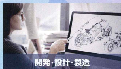
開発・設計・製造

製品組み立て手順の標準化をサポートします。これにより、組み立て時のミスやロスが低減し、生産効率が上がります。また、新工場立ち上げの際など、スタッフへの教育効果が高まります。