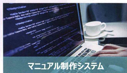
マニュアル制作システム

製品を安全に、また正しく使用していただくための取扱説明書やサービスマニュアルなどを制作します。また、媒体を問わず、製品の使用情報に関する企画・制作も承ります。