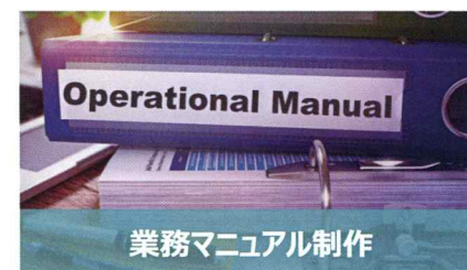
業務マニュアル制作

PLリスクを回避するために、また、国際規格への準拠度を診断し、レポートを作成します。通関や市場抜き取り検査での不合格を避けるためには、国際規格への準拠が必要不可欠です。