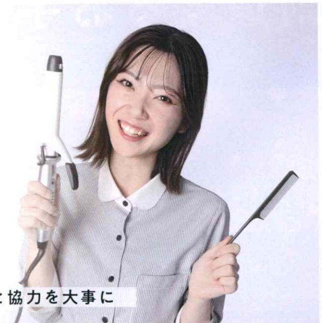
笑顔と協力を大事に

今後の目標は、お客様一人一人に寄り添いその人自身の個性を生かして、この人にお任せしたい!と思われるような人になることです。そのために流行などの知識や技術が必要なため、SNSでの情報収集をこまめに、自分の知識と能力を高めています。