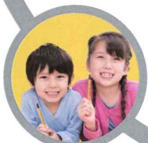
世界が認めた七田式教育 SHICHIDA 七田式 幼児教育