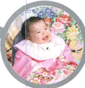
大進創寫館 STUDIO MIZUKI PHOTO Totate トータルフォトスタジオ