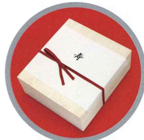
進物の大進 ギフト・記念品専門店

大進グループではギフト、写真館、ブライダルサポート、幼児教育から不動産事業まで、グループ一体となった事業展開により、お客様のトータルライフサポートを第一に考え、更なる充実、躍進を目指しております。