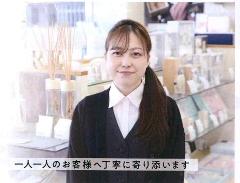
一人一人のお客様へ丁寧に寄り添います

私は過去の自分よりも出来ることや知識が増えた時に成長を感じます。仕事で分からないことや問題が出た時、先輩や上司に相談し自分の知識として身につけていきます。この繰り返しの経験で得た知識を後輩や他の従業員に伝えていけるようになること、それが今後の目標です。