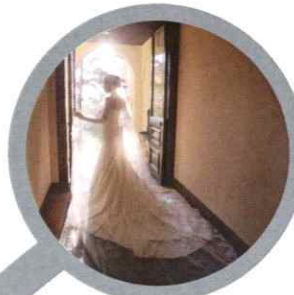
おふたりの想いをカタチに 大進ブライダルサロン 式場無料紹介・結婚準備

グループ間のつながりを活かす事でより多くのお客様のご要望に応える事ができ、それが当社の最大の強みとなっています。現在は各事業の連携によって、より良い商品・サービスの相乗効果を発揮しています。今後も私たちにできる新たな可能性を見つけ、「地域のお客様の役に立つこと」を第一に考え、更なる進化をしていきます。