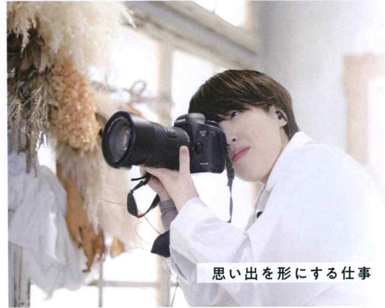
思い出を形にする仕事