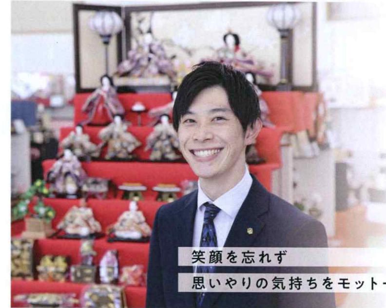
笑顔を忘れず 思いやりの気持ちをモットーに