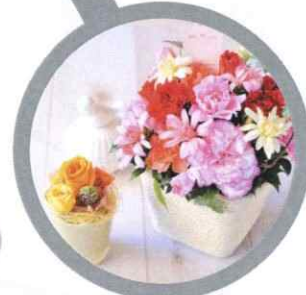
Daishin hanaichiba フラワーショップ