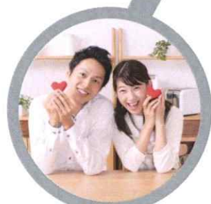
良縁 大進 良縁の大進 結婚相談