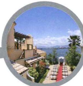
高島のガーデンハウス「リーベリア」 LIEBERIA