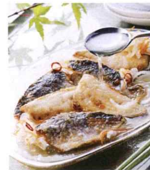
国際線機内食ファーストクラス採用 記事が日本経済新聞に掲載される 写真 / 境港産あじのまるやか甘酢