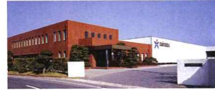
ダイマツ 本社工場 2001