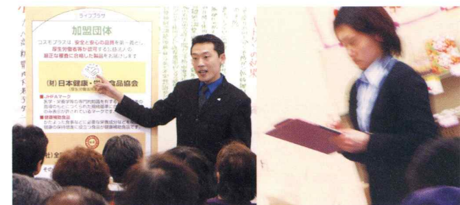
基本ポリシーは、「地域に役立つことによって、己が生かされる」

地域の皆様とのふれあいを通じて確かな健康の輪を広げる説明講習販売会「ライフプラザ」。ここでは、生活に役立つ健康情報・提案をお届けしながら、健康・自然食品の普及・販売を行う広場です。「お客さま第一主義」を基本に、誠実と信用を積み重ねる営業活動を展開して、地域の健康づくりへの貢献に努めています。