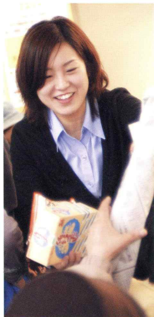
より良い商品をご納得のうえ、お求めいただけます。