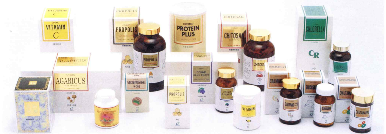
品質を最優先して開発されたPB商品