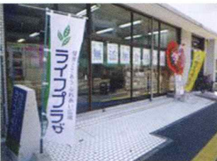
グループ企業により「通販事業」を展開