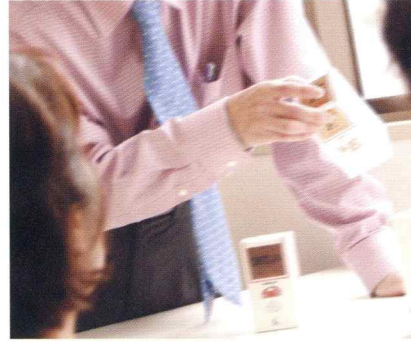
商品をしっかりと選び抜いて