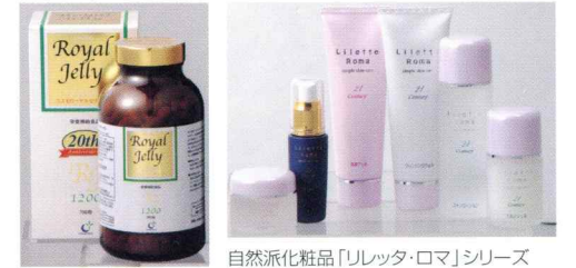
自然派化粧品「リレッタ・ロマ」シリーズ

コスモプラスの取扱い商品は、すべてが品質本位主義で厳選された800品目。自社開発商品ブランド(PB商品)をはじめ、その他取扱い商品も、(財)日本健康・栄養食品協会(日健協)や(社)全国ローヤルゼリー公正取引協議会認定の優良商品など、お客様にさらなる満足をご提供する商品群をお届けしています。