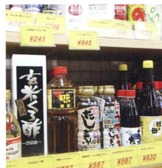
多彩な商品が人々の健康に貢献

親しみやすさあふれる店舗「テラス」。九州一円に11店舗を展開するこのお店は、ライフプラザで出会ったお客様に、いつでも手軽に信頼の健康・自然食品をご購入いただくための常設店です。もちろん、ここでも単なる商品の販売にとどまらず、お客様の立場から、健康づくりのお手伝いをする姿勢を大切にしています。