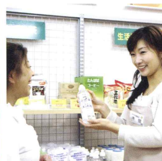
地域密着の健康づくりの拠点、常設店「テラス」