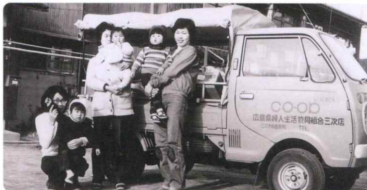
生協ひろしまの前身「広島県婦人生協」の配達の様子