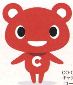
CO・OP共済 キャラクター コーすけ

「組合員同士のたすけあい」を原点に生まれたCO・OP共済。医療保障を中心とした《たすけあい》、死亡保障を手厚くした《あいぶらす》《あいあい》、火災共済など、手ごろな掛金で充実した保障を備えています。ファイナンシャルプランナーによる保障の相談会も好評です。