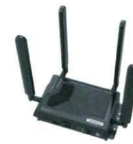
エッジコンピューティング・ゲートウェイ 「CONEXIOBlackBear」

20年超のM2M / IoT経験を持つエンジニア、様々な業界で知見豊富な中堅、新しい発想と行動力溢れる若手社員が、IoTの新規導入支援と30万箇所のお客様サポートに日々尽力しています。