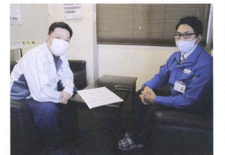
④協力会社と運搬方法の相談

様の質問に対する的確な返答がその場で出来る為、お客様の信用を頂けるチャンスになっています。