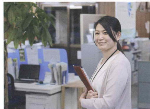
いつも冷静なK主任

入力し、担当者が外出先からも見積を作成できるようにサポートしています。 契約書作成 案件を受注後は、産廃の取引に必要な契約書を営業担当が収集した情報を基に作成します。 案件管理 担当ごとの営業進捗や各事業部の月々及び、期末の売上見込みを算出する為に案件発生ごとに表で管理し、売上見込みや受注可能性を入力します。 契約書管理、案件管理ソフト 契約後は、専用の管理ソフトに契約情報を入力することで、受け入れ準備、マネフェスト、情報管理、請求までを一括管理しています。