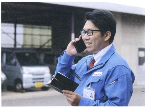
笑顔が素敵な社員

なのか？作業場所の側まで車両が進入できるか？吸引車のホースは何m必要か？などの作業条件をヒヤリングし、廃棄物処分であればサンプルの入手やWDS(廃棄物データシート)、SDS(安全データシート)という廃棄物の性状を表す情報提供を頂き、お客様と一緒に必要事項を記入していきます。廃棄物の中には毒性があるものや、爆発の恐れがあるもの、混ぜ合わせると激しい化学反応を及ぼすものがあります。その為正しく処理するのに加え、実際に処理を行う人たちの安全の確保のために十分な情報収集が必要です。 現地確認は必要に応じて各部署の責任者が同行し、必要情報の漏れがないかチェックします。お客