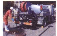
下水道管理施設メンテナンス この車で管路内の詰まり直しや洗浄を行います。