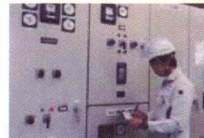
水処理施設維持管理 電気や機器が安定的に稼働するように日々の点検を行っています。