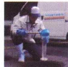
浄化槽維持管理 浄化槽の水の状態を検査しています。

誰かに喜んでもらえる仕事がしたい。 昭和36年創業以来、浄化槽や下水道の維持管理を通じてこの街の日常を守ってきた私たち。 これからも、人々の当たり前の日常を守っていこう。そういう思いを込めて、地域社会に貢献するべく毎日仕事に励んでいます。