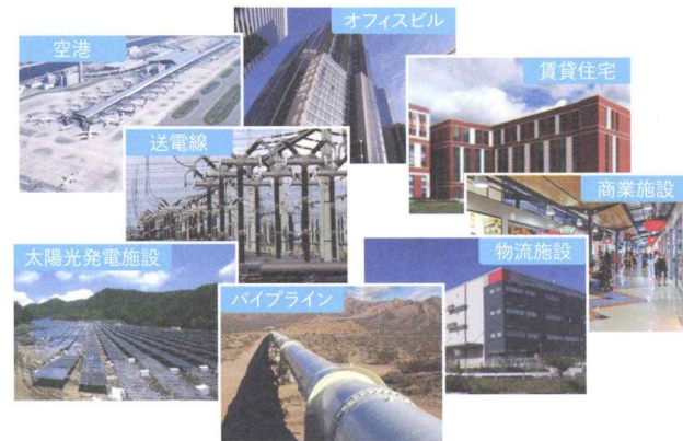
オルタナティブ投資の例

近年、運用業務の領域は広がっており、投資活動を通じた社会的意義も高まっています。例えば、オルタナティブ投資(上場株式や流動性のある債券以外の、実物資産や非公開株式等への投資)においては、社会にとって必要不可欠なサービスであるインフラ施設等への投資、あるいは企業に対する成長資金の供与等を通じて、地域住民の方々や経済全体への貢献を果たしています。