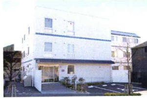
グループホーム 「成城さくらそう」(東京都世田谷区)