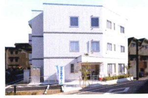
グループホーム 「千歳台さくらそう」(東京都世田谷区)