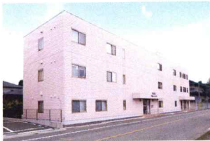
グループホーム / 小規模多機能ホーム 「戸田さくらそう」(埼玉県戸田市)