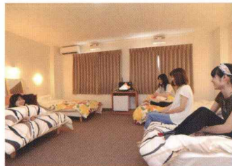
親睦を深めるレギュラールーム