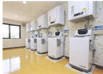
いつでも使えるランドリールーム