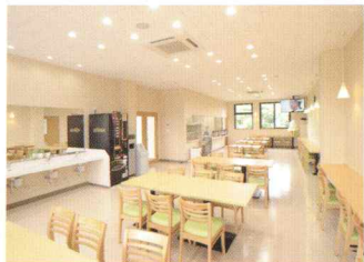
明るく清潔な食堂(22時まで開放)