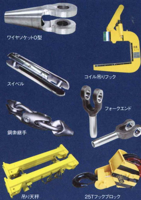
ワイヤソケットO型