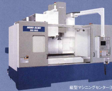
縦型マシニングセンター (MV653)