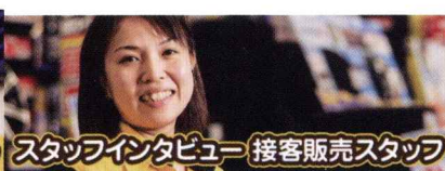
スタッフインタビュー 接客販売スタッフ