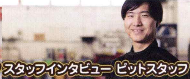
スタッフインタビュー ピットスタッフ