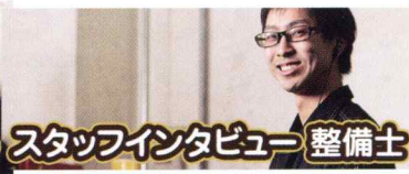
スタッフインタビュー 整備士