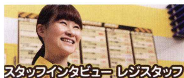
スタッフインタビュー レジスタッフ