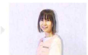
副主任・主任・園長