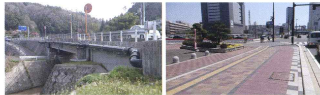
湯来南地区特環下水道築造26-3号工事 東5区常磐橋若草線電線共同溝整備工事(26-1)

上下水道の新設工事から、老朽化対策としての管交換・修繕工事、 また緊急時の対応まで幅広く対応しています。