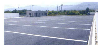
ダイハツ駐車場整備工事

公共工事で培ってきた技術を活かし、企業様から一般のお客様まで幅広く細かなご依頼にも お応えしています。