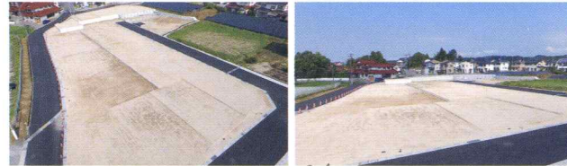
八本松造成工事 八本松造成工事

宅地化のための造成や、駐車場化のための造成など、 さまざまな用途に合わせて土地の造成を行います。