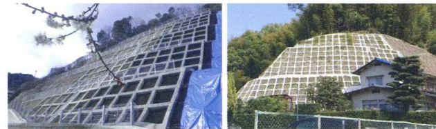
深川八丁目地区(追加)急傾斜地崩壊対策工事(27-1) 中小田古墳群法面改修工事(26-2)

落石や災害対策など、安心して安全な生活を送れるよう、 幅広い工法による法面工事の施工にも対応しています。