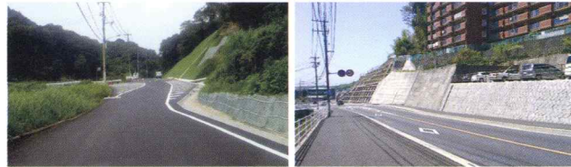
東1区427号線道路改良工事—道路改良工事 主要地方道広島中島線(上温品区)道路改良工事(23-1)

当社の得意分野のひとつが土木工事です。 中でも道路工事の分野で数多くの実績を残しています。