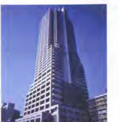
アーバンビューグランドタワー