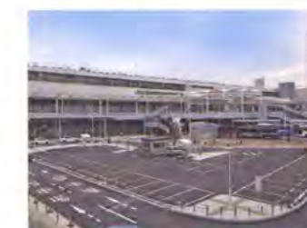
広島駅北口ペDESTリアンデッキ