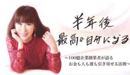
オンラインサロン事業

未来を創出する若者の健康をサポートすることを考え、商品開発からeスポーツイベントのサポーター、デジタル時代に世界で通用する人材の育成など、様々な分野でeスポーツの展開を行なっております。