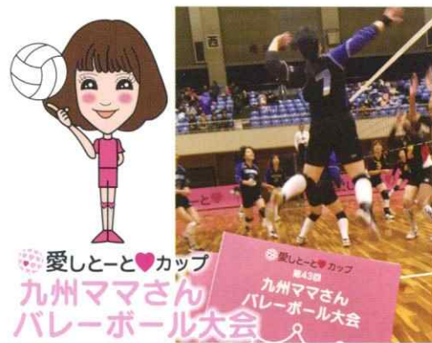
愛しとーと♡カップ 九州ママさん バレーボール大会

福岡県医師会、福岡県看護協会、九州介護協会、福岡県教育委員会、那珂川市、福岡県の県立学校へ、防護ガウンなどの医療用備品を寄贈しました。これからも皆様のお役に立てますように、そして笑顔で過ごせますように活動して参ります。