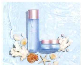
人にも地球にも優しいビューティーブランド『UMIKARA』