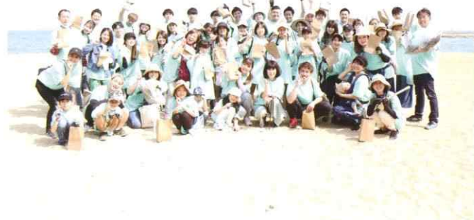
▲ビーチクリーン活動 in 百道浜