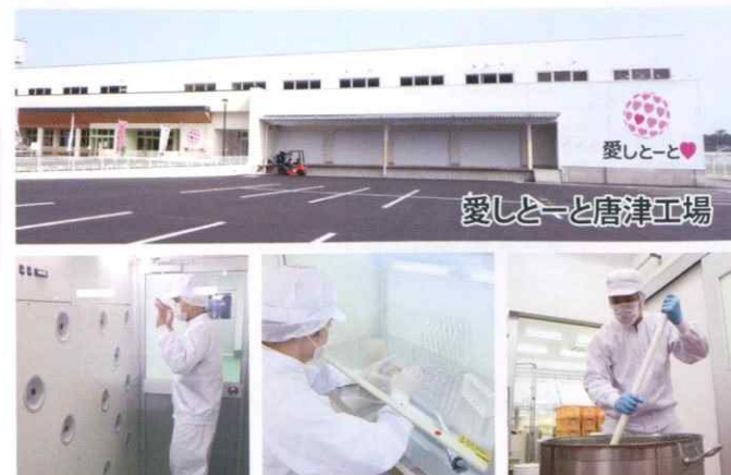
愛しとーと唐津工場

愛しとーの商品は、第三者機関のJHFSに認められたGMP認定工場に製造・管理しています。製造スタッフの衛生管理はもちろんのこと、原料の入庫から製造・出荷、全ての過程において品質にバラつきがないか、不要物が混入していないか等、厳しいチェックをクリアした物だけがお客様の元へ届けられています。