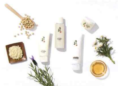
おからを使ったスキンケア『五ヶ山豆腐化粧品』

商品パッケージに再生紙やバイオマスインキを利用することにより、地球温暖化防止や産業廃棄物の減少、森林資源の保護など地球の環境保護に配慮しています。地球にも人にも優しい商品を販売しています。