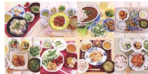
▲バランスの摂れた健康的な無料の社員食堂