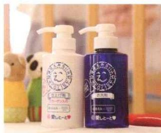
海に還る洗濯洗剤『エコリスト』