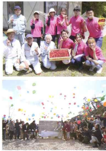
▲那珂川市の皆さんと一緒に。

地域を活性化して恩返しをしたい。そんな思いから、愛しとーと本社がある那珂川市のシンボル花木である幻の果実「やまもも」と『うるおい宣言』のコラボ商品を発売。毎年地域のみなさんと一緒にやまもも収穫を行っています。また、子ども達が住みやすく、皆々様の笑顔が溢れますようにと願いを込めて、福岡県那珂川市の市政施行を記念して、桜の植樹式を行いました。