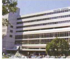
博多支店 (コールセンター)