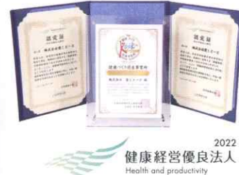
2022 健康経営優良法人 Health and productivity