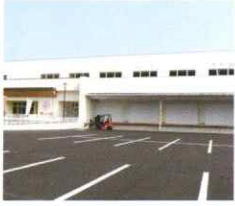
唐津支店 (物流センター / GMP 工場)