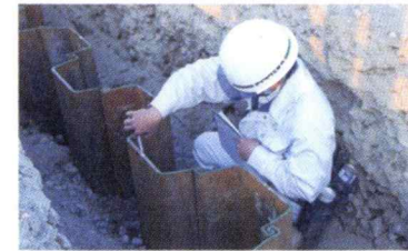
暮らしや人を思い描きながら作業することが、血の通った構造物に欠かせない大事なことです。