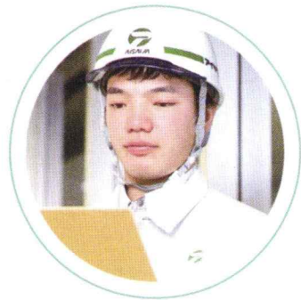
／ 建築技師 ／

トンネル、橋梁、道路、ダム、河川堤防などのインフラ整備を行い、社会基盤を構築しています。国や地方、公共団体が施主となる工事が多く、スケールの大きい現場で、指揮官として腕を振るうことができます。