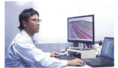
この仕事は段取りが要。職人さんが仕事をしやすいように先を見越した行動を心がけています。

入社後トンネル工事、護岸工事、送水管付設工事とさまざまな現場を経験させてもらっています。トンネル工事の現場は、雨天時には落石が起こる場所でもあり、何度も行き止まりになっていた場所。地元住民にとって待望のトンネルで、近隣に住む人から「トンネルができれば便利になるからうれしい。いつできるの？」と声をかけられたことがあります。生活が便利になる日を首を長くして待ってられる姿を目の当たりにしたとき、自分の仕事が誰かの役に立っていることを実感し、気持ちを奮い立たせてくれました。この経験は、構造