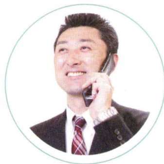
／ 営業職 ／

マンションや公共施設、工場など、確かな品質を備えた安全な建物を提供しています。私たち施工者はもちろんのこと、協力業者である職人、お客様、設計者が一丸となって建築に携わります。最近では、耐震構造や環境対応も求められています。