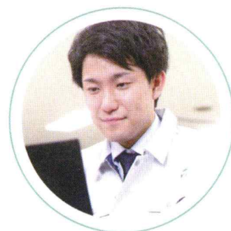
／ 事務職 ／

社外に対して会社の顔となって対応する部署で、お客様との信頼関係の構築が欠かせません。お客様の要望に基づき、工期、コストなど求められることに対して設計や積算部門と連携を図りながら仕事を進めます。