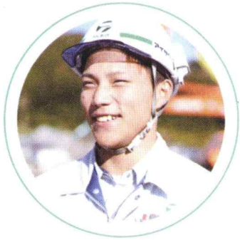
／ 土木技師 ／

トンネル、橋梁、道路、ダム、河川堤防などのインフラ整備を行い、社会基盤を構築しています。国や地方、公共団体が施主となる工事が多く、スケールの大きい現場で、指揮官として腕を振るうことができます。