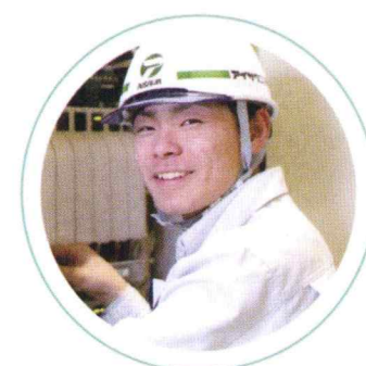
／ 電気・機械 ／

現場のサポート役として現場職員とのやりとりを大切に、総務、人事、経理などの業務を担当しています。社内の連携を保ちながら、現場がスムーズに進められるようにサポートを行う“緑の下の力持ち”と言える仕事です。