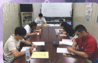
▲ACS21委員会主催の 「新入社員フォローアップ研修会」

ACSでは、社員一人ひとりがスペシャリストとしての実力を養うため、新入社員研修や配属後の部署別研修、さらに各ポジション・管理職研修という形で、実務に即した研修や各種専門セミナーを行い、業務上のバックアップを図っています。