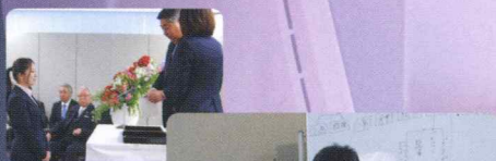
▲社員を支える豊富なバックアップ体制

また、各拠点を中心に独身寮があり、地方採用者や通勤事情により入寮を希望する社員が利用しています。