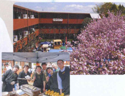
▲様々な屋台が繰り出し盛大に行われる観桜会

社員が親睦を図り家族的な絆を育むことができるよう、いろいろなイベントにも力を入れています。4月には成田にある社員寮の中庭で盛大なお花見が催されます。また共済会ではバスツアーやボーリング大会などを開催し、楽しい時間を過ごします。さらにゴルフなどの部活動、日本全国の提携保養施設などもあり、充実した休日をサポートします。