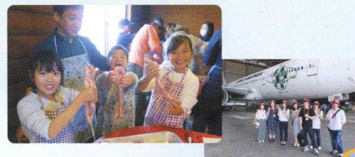
▲共済会ツアーは、社員のお楽しみのひとつ 仕事を忘れてみんなで盛り上がります